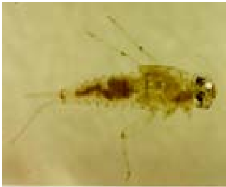
Ordo : Ephemeroptera Familia : Baetidae