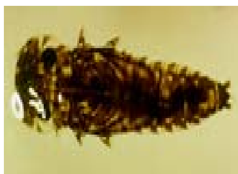
Ordo : Ephemeroptera Familia :