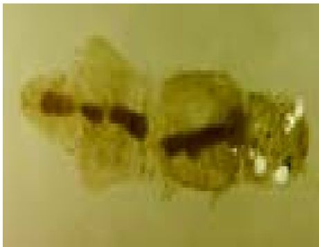
Ordo : Ephemeroptera Familia : Caenidae Heptagenidae