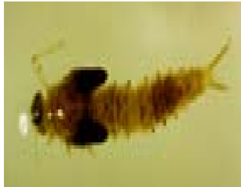
Ordo : Ephemeroptera Familia : Baetidae