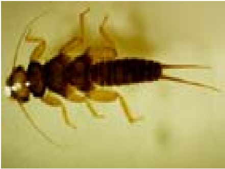
Ordo : Plecoptera Familia : Perlodidae